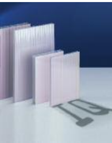
Makrolon® multi UV IQ-Relax