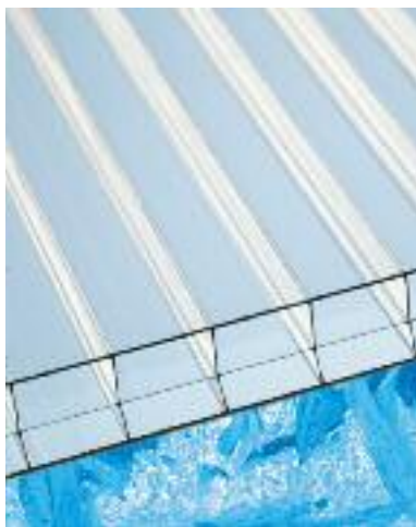
Resistente alla grandine