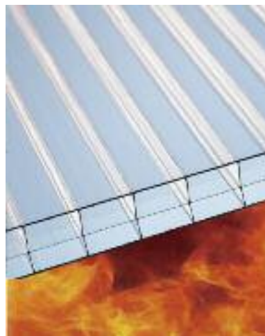
Sicura reazione alla combustione